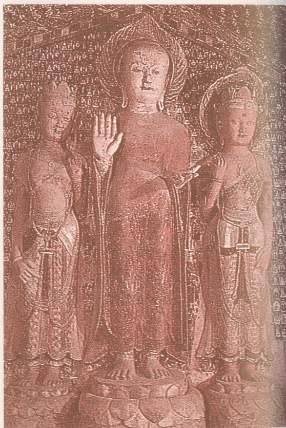
佛與菩薩其腳掌與地面完全貼住的「足安平相」 隋·莫高窟 427 彩塑

四十齒，以今之口腔病理之觀點來看，恐怕會疑心諸佛均得多生牙之毛病，但是從多生牙之觀點來看