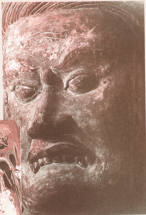
將齒牙突出做忿怒狀的不動明王，係以威力使眾生轉向佛法的如來使者 日本·京都東寺（平安時期）