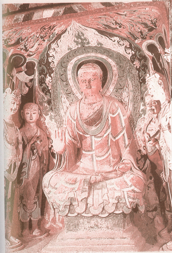
釋迦說法 49 年 隋·莫高窟 419 彩塑